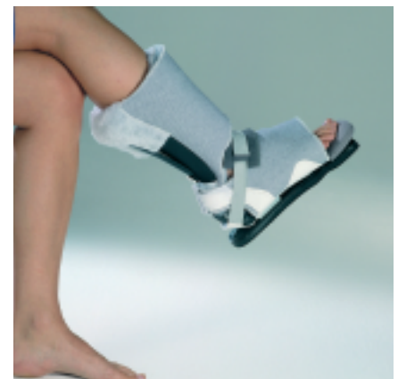
Abbildung 1 Die Abbildung zeigt die Orthese Oscar Plus.

Das Grundelement der Oscar Plus® Lagerungsothese besteht aus einer anatomisch geformten Kunststoffschiene aus Kydexmaterial für Unterschenkel und Fuß. Im Fußsohlenbereich ist ein 12 mm starker, abnehmbarer Sohlengummi angebracht, der kurze Gehstrecken wie z. B. Toilettengang ermöglicht. Der in der Länge verstellbare Vorfußteil ist im Ballen-Zehenbereich mit einer aufschiebba- ren Polsterung versehen. In Höhe der Wade ist auf der Rückseite der Schiene ein circa 16 cm langer und 3 cm breiter starrer Kunststoffausleger angeschraubt, der zur Rotationskontrolle eingesetzt werden kann. Der gesamte innere Bereich der Schiene (ausgenommen der Ferse) ist mit einem synthetischen Antidekubitusfell ausgekleidet. Im Bereich des Fußes ist das Fell auf der Unterseite mit Nylongewebe verstärkt. Zum Verschließen sind auf der Außenseite des Polsters Klettverschlüsse aufgenäht. Ein weiteres Verschlussband mit Polster wird über das Sprunggelenk